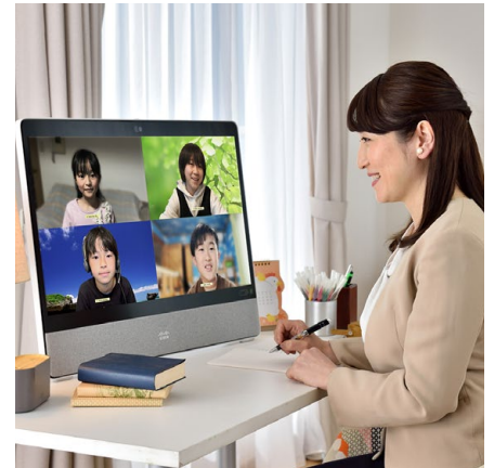
多様な業種業態で求められる 業務のオンライン化