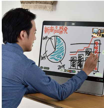
テレワーク環境下の 円滑なビジネス推進