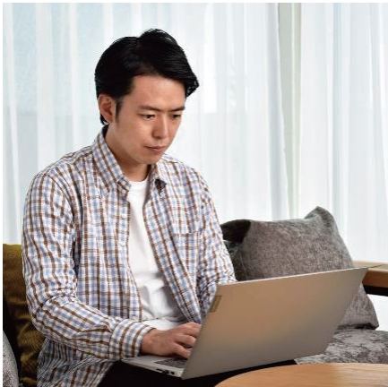
新型コロナウイルス発生に伴う テレワーク需要の増大